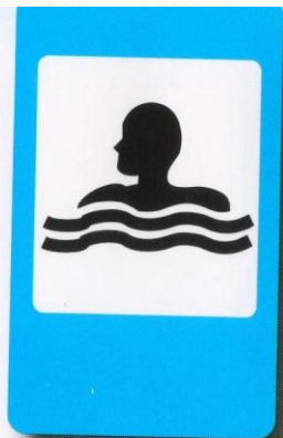
Бассейн или пляж

Этих знаков очень много, Все укажут вам дорогу. Вот бассейн, вот больница. Тут кафе, а тут милиция.